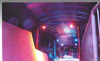
動く夜景を堪能した後は、光のトンネルがあなたをお出迎え。