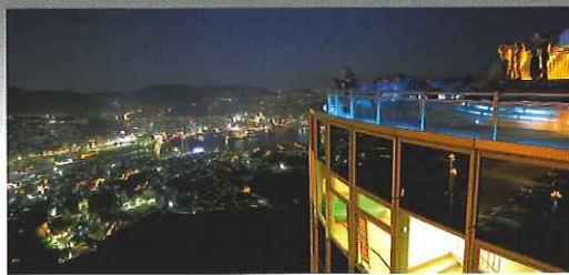
トンネルを抜けると日本、世界が認める夜景を一望できる山頂展望台へ。