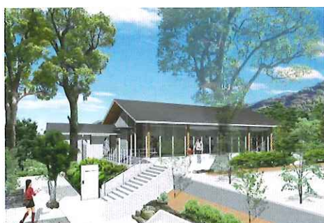
淵神社駅舎完成予想図

※ライトアップのお問い合わせは 長崎市観光政策課 TEL095-829-1152へ