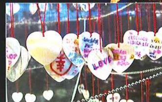
ハート型のプレート付き赤い縁結びの紐を結びつけてカップルや夫婦の愛を誓う「プロミスハート」