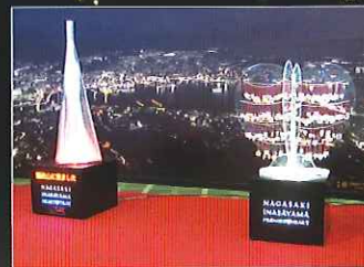
美しい光を放つ大小のハートでできたツリーのモニュメント