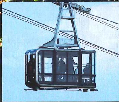
KEN OKUYAMA DESIGNによる全面ガラス張り世界初ビューデザインのロープウェイに乗って空中散歩。