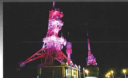
長崎の夜景を更に彩る山頂展望台のライトアップも平成28年4月開始予定。

※ライトアップのお問い合わせは 長崎市観光政策課 TEL095-829-1152へ