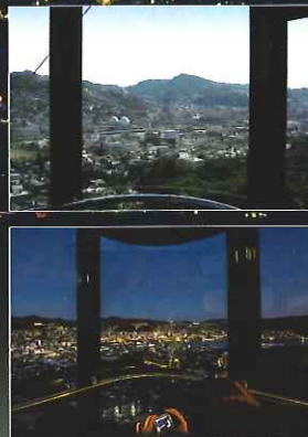
ゴンドラからの眺め(昼と夜)